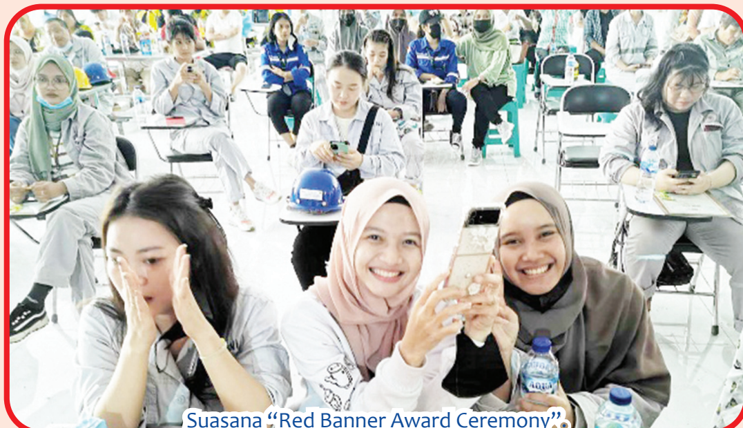
Suasana “Red Banner Award Ceremony”.

nyatakan terima kasih kepada para guru Tiongkok yang tiada kenal lelah mengajar dan menaruh perhatian. Sehingga dirinya dapat menang dari berbagai kesulitan sekaligus menjadi lebih percaya diri dan kuat.