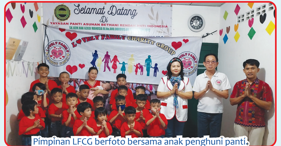
Pimpinan LFCG berfoto bersama anak penghuni panti.

JAKARTA (IM) - Memperingati International Women's Day, Lovely Family Charity Group (LFCG), Rabu (8/3)