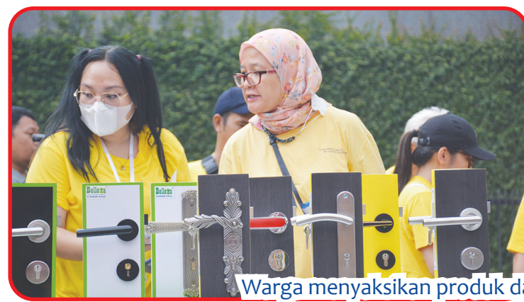
Warga menyaksikan produk dan berpose di booth Kenari Djaja.

“Menyambut hari jadi Kenari Djaja yang sudah memasuki usia 58, kami mengadakan acara jalan santai bersama sebagai bentuk