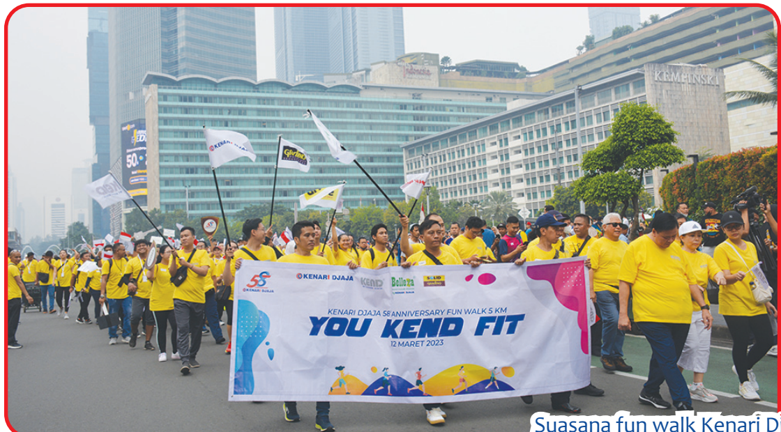
Suasana fun walk Kenari Djaja yang berlangsung meriah.

Lewat apa yang dihidirkannya tersebut, kini produk dari Kenari Djaja telah dikenal secara luas di seluruh Indonesia dan telah dipercaya oleh para pelanggan dan mitra bisnisnya selama lebih dari 5 dekade. • kris