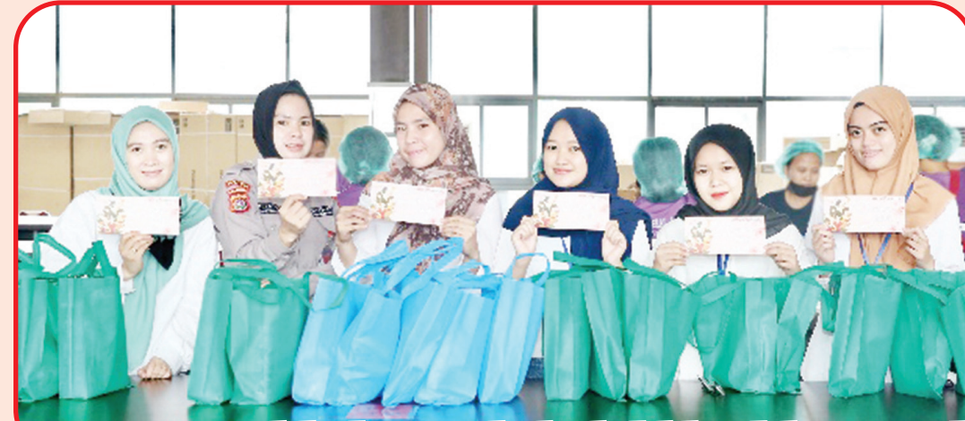
PT Virtue Dragon Nickel Industry memberikan hadiah kepada karyawan pada peringatan International Women's Day.