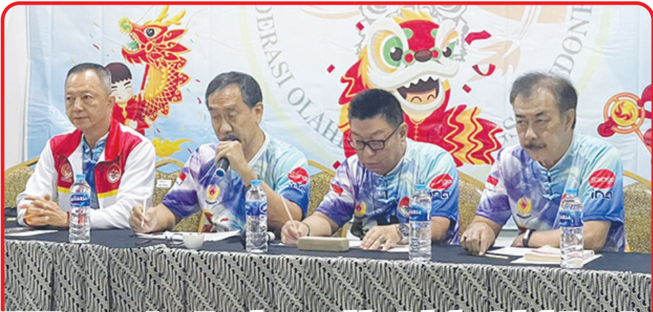
FOBI Pengprov Jawa Tengah mengadakan Pelatihan Pelatih Liong, Barongsai dan Pekingsai pada 11 dan 12 Maret 2023 di UTC Convention Hotel Semarang. Pelatihan ini diikuti oleh 85 orang peserta dari berbagai daerah serta lintas provinsi. • lus