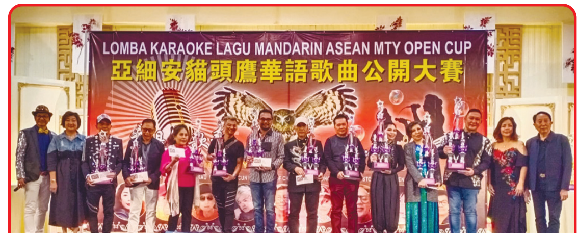
Pemenang kelompok B Lomba Karaoke Lagu Mandarin ASEAN MTY Open Cup.