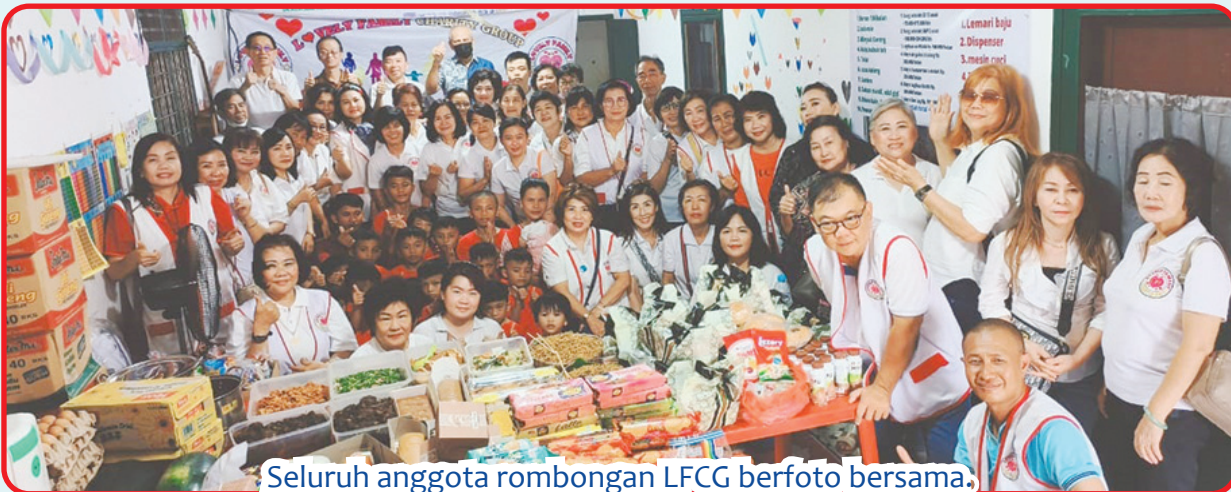
Seluruh anggota rombongan LFCG berfoto bersama.