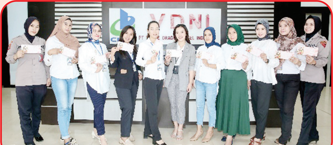
Seluruh karyawan PT Virtue Dragon Nickel Industry mengucapkan selamat International Women's Day.

SULAWESI (IM) - Segenap karyawan wanita PT Virtue Dragon Nickel Industry, Rabu (8/3) lalu merayakan International Women's Day.